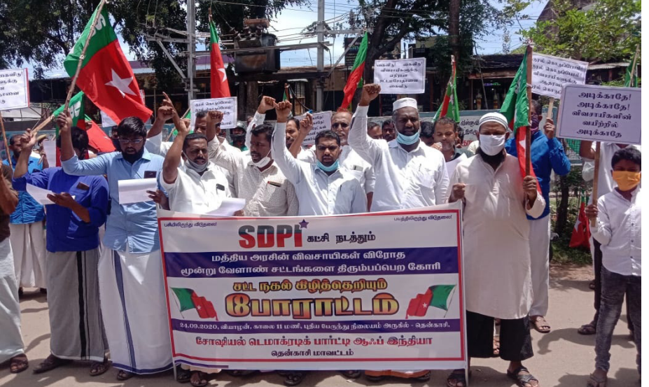
தென்காசியில் எஸ்பிடிஐ சார்பில் விவசாய சட்ட மசோதாவை கண்டித்து சட்ட மசோதா நகலை கிழித்து எரிந்து புதிய பஸ் நிலையம் முன்பு பேராட்டம் நடத்தினர்.