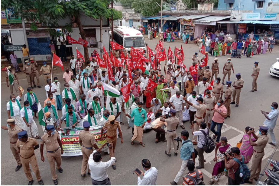
தென்காசியில் இடதுசாரிகள் மற்றும் விவசாயசங்கத்தினர் விவசாய சட்டம் சோதாவை கண்டித்து பழைய பஸ் நிலையம் முன்பு சாலை மறியல் செய்தனர்