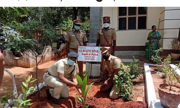
நடந்துகொள்ளவேண்டும் அவர்களோடு நட்புடன் பழக வேண்டும் இன்னும் சிறப்பாக செயல்பட்டு அறிவுரை வழங்கினார் அதன் பின்னர் கடையநல்லூர் காவல் நிலையத்தில் மாவட்ட காவல் கண்காணிப்பாளர்கள் மற்றும் துணை கண்காணிப்பாளர்கள் ஒவ்வொரு குறை ஆய்வின்போது காவல் நிலைய வளாகத்தில் இயற்கை ஆர்வலர்கள் ஏற்பாட்டில் மரக்கன்று நடுவது வழக்கம் அதன்